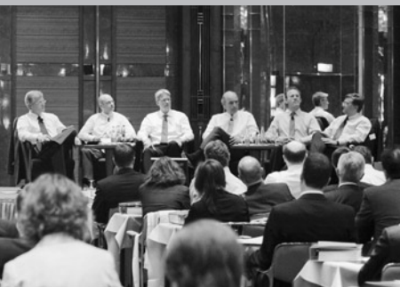
Auf dem Podium diskutierten namhafte Referenten über die Zukunft der Private Equity-Branche.

Die Teilnehmer der 6. Handelsblatt Jahrestagung setzen sich wie folgt zusammen: