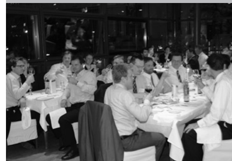
Spannende Gespräche und Networking-möglichkeiten ergaben sich in den Pausen und bei unserer gemeinsamen Abendveranstaltung.