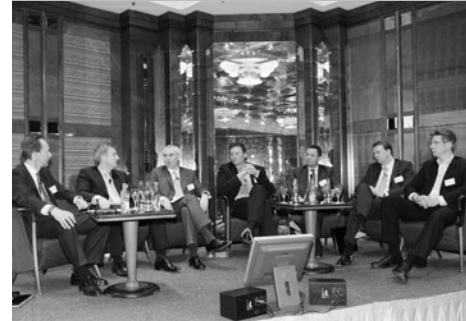
Die Referenten beantworteten auch individuelle Fragen aus dem Teilnehmerkreis.

» Alle weiteren Informationen finden Sie unter: www.vc-pe.de