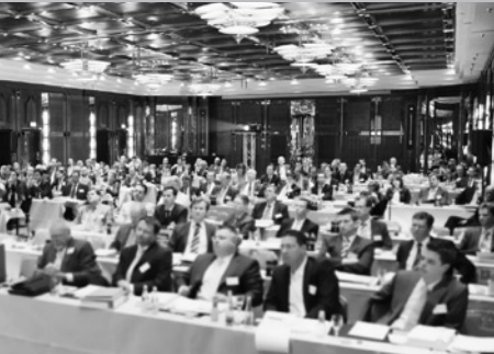
Vorträge zu den aktuellen Entwicklungen der Private Equity-Branche begeisterten unsere Teilnehmer.